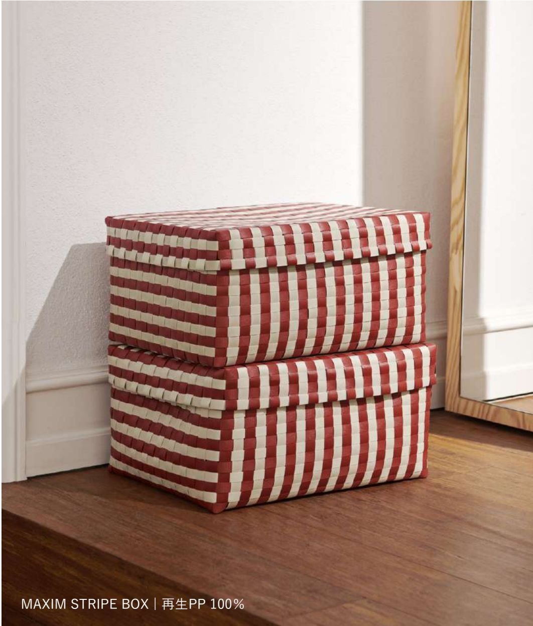
MAXIM STRIPE BOX | 再生PP 100%