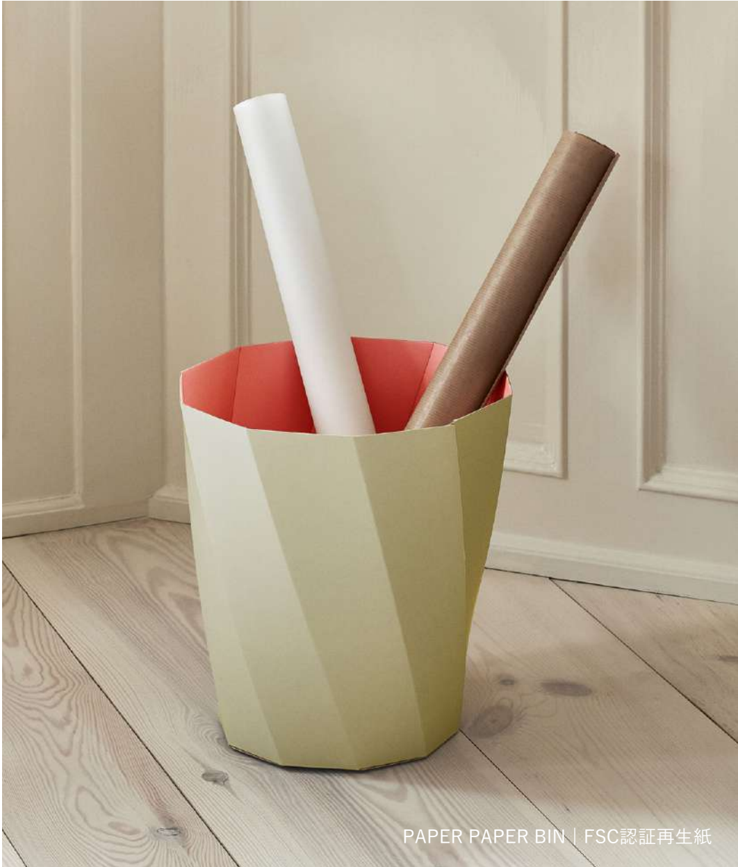
PAPER PAPER BIN | FSC認證再生紙