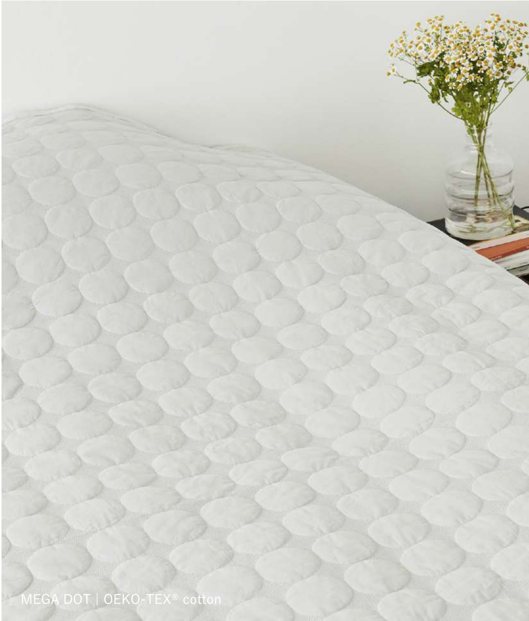
MEGA DOT | OEKO-TEX® cotton