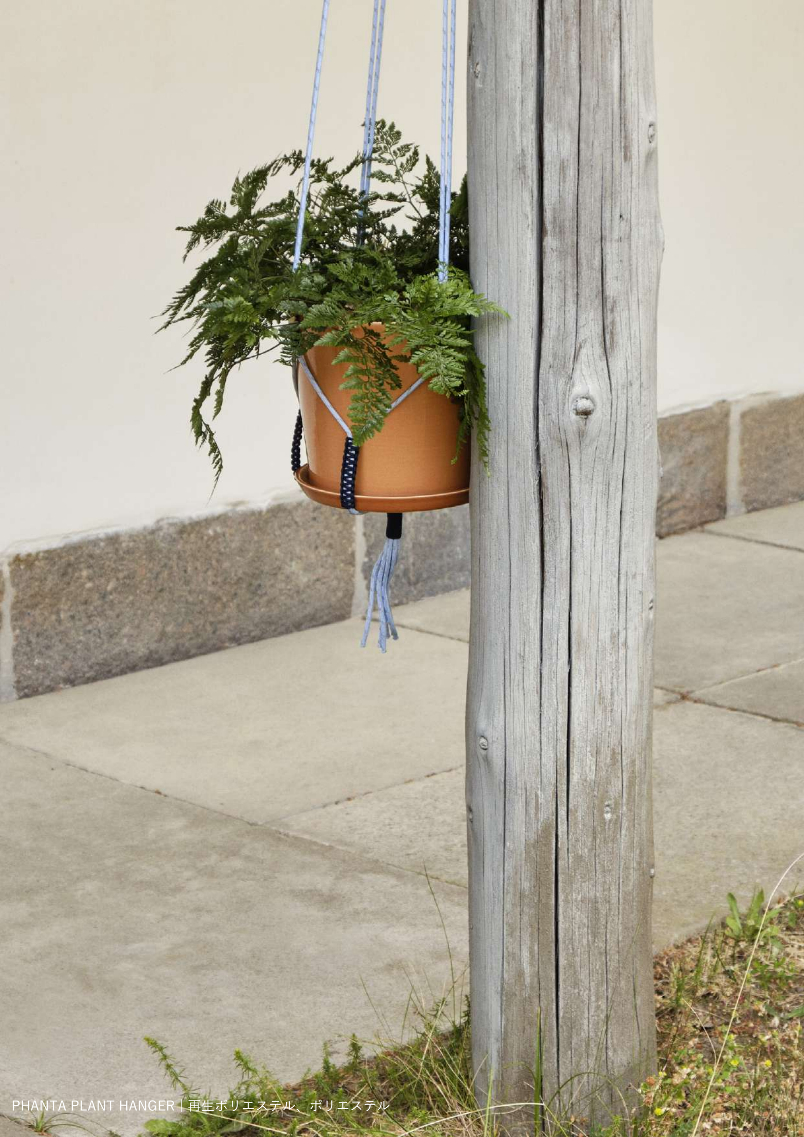
PHANTA PLANT HANGER | 再生ポリエスデル、ポリエスデル