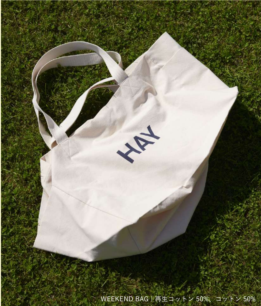
WEEKEND BAG | 再生コットン 50%、コットン 50%