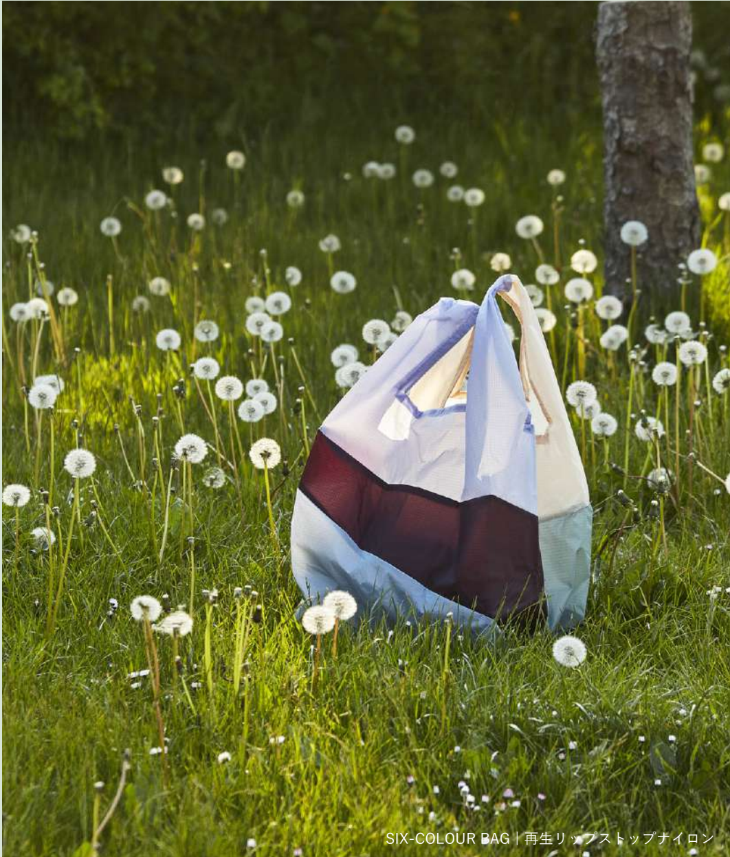
SIX-COLOUR BAG | 再生リップストップナイロン