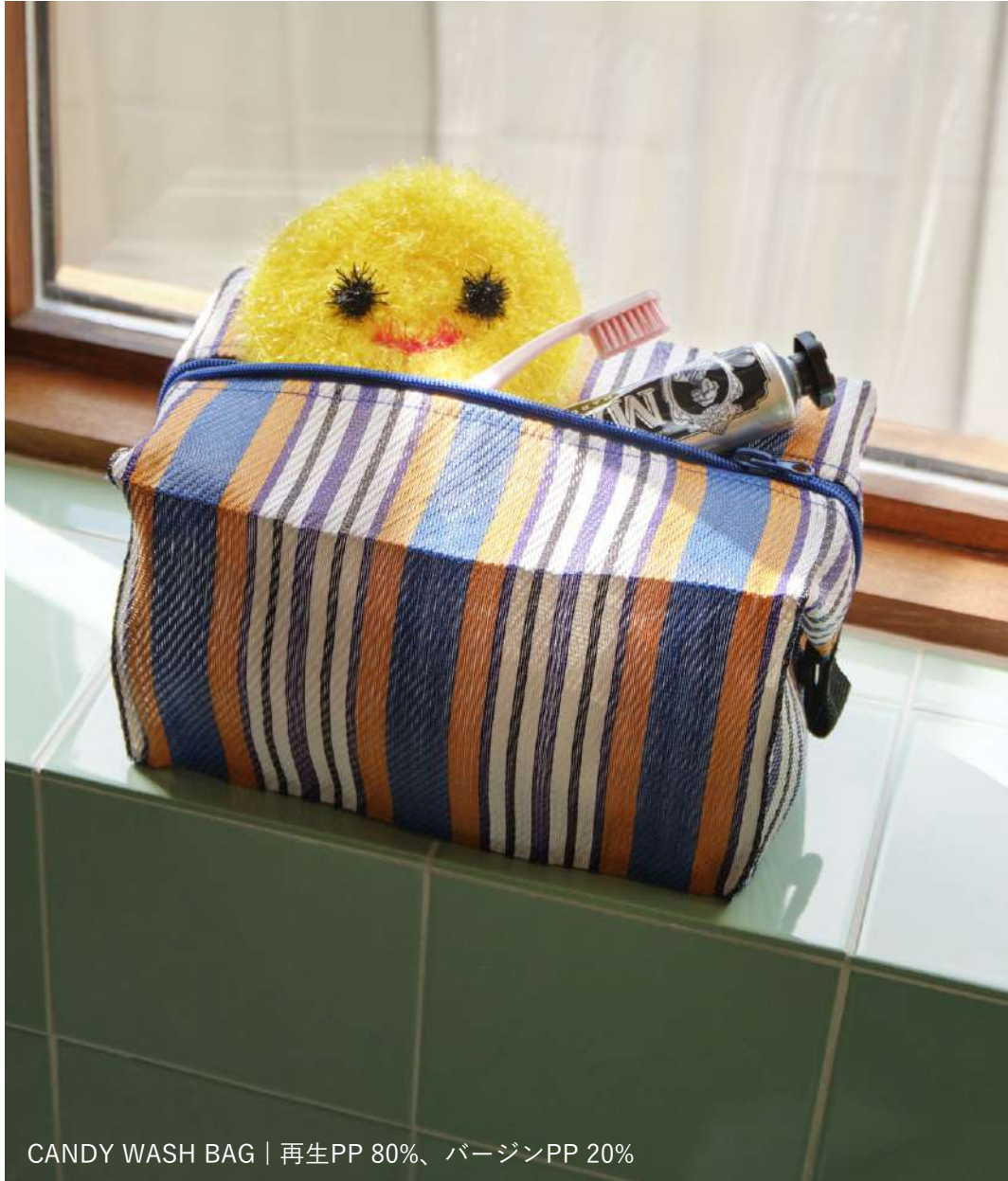
CANDY WASH BAG | 再生PP 80%、バージンPP 20%