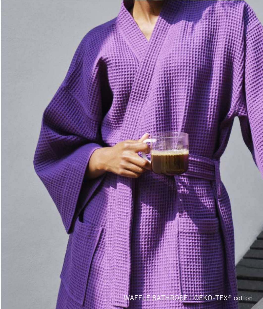
WAFFLE BATHROBE | OEKO-TEX® cotton