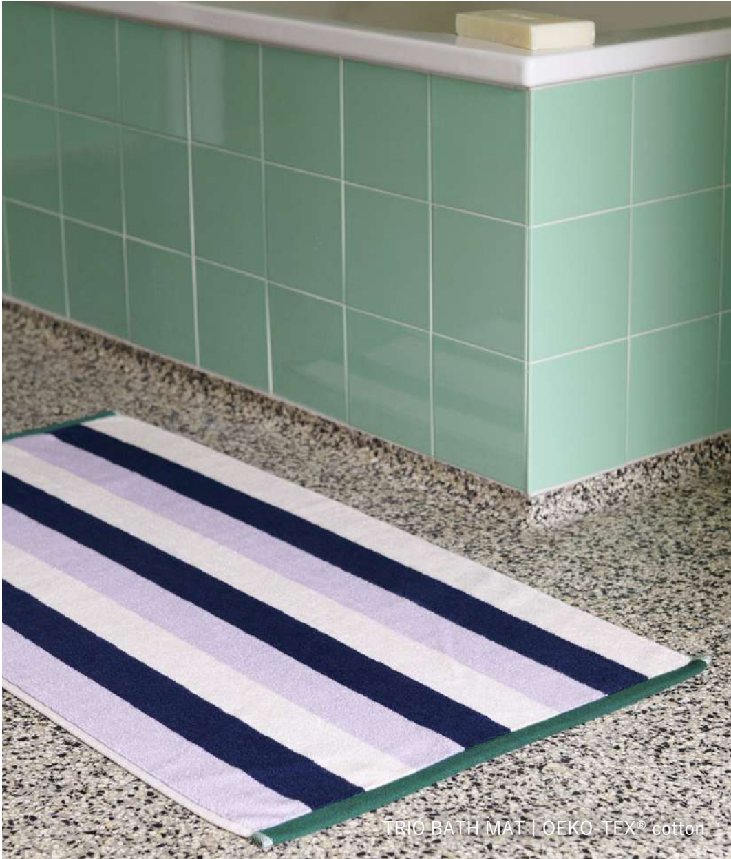
TRIO BATH MAT | OEKO-TEX® cotton