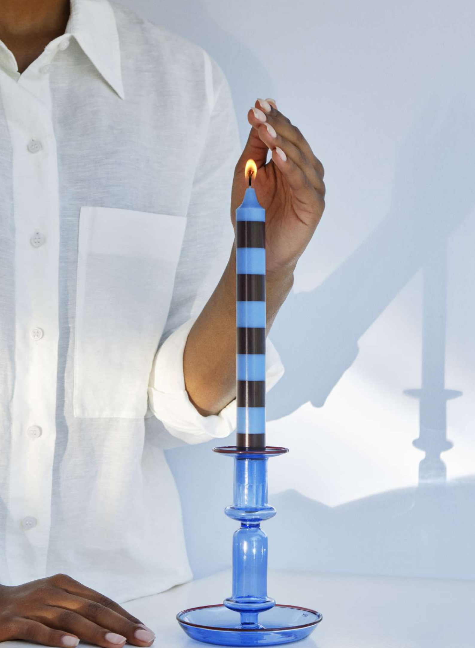
STRIPE CANDLE | ステアリンワックス | ノルディックスワン・エコラベル